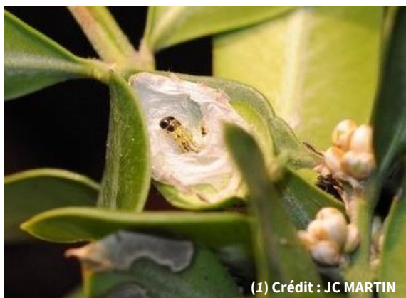
(1) Crédit : JC MARTIN